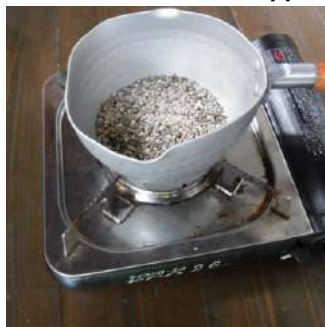
1・鍋に小石を入れて強火で 1~2分だけ加熱

※さらし布が焼け焦げて劣化した際は、ご自宅にあるハンカチや古い布で代用して下さい