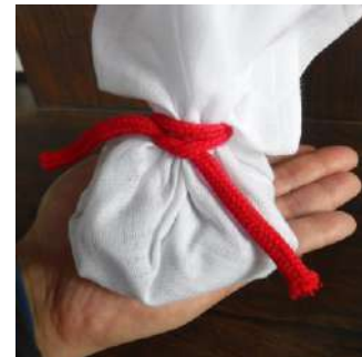
4・紐を結べば完成！後は…気になる所へ当てるだけ！