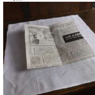
2・加熱の間にさらし布1枚を広げ、その上に当て紙を置く