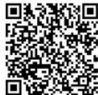
小石温石の説明動画

小石を単に温める温石(これでも十分に内臓が温まる)に加え、アレンジ手当も出来ますので、ぜひ皆さんの日常生活に 小石の温石 の実践習慣を！