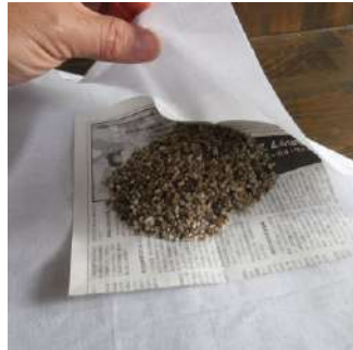
3・小石を当て紙上に移しさらし布の四隅を束ねる